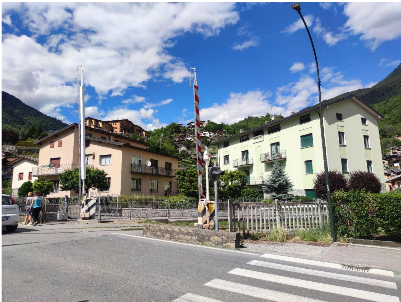
Figura 3 - Vista del passaggio a livello oggetto di intervento

tratti di marciapiede oggetto di riqualificazione, avendo aumentato la larghezza del passaggio a livello.