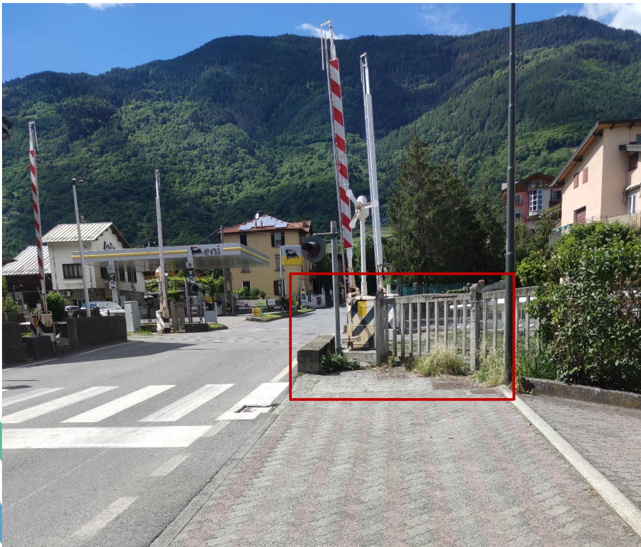
Figura 2 - porzione di attraversamento ferroviario oggetto di allargamento

L'interferenza più evidente per le lavorazioni di cantiere è la presenza della linea ferroviaria Brescia-Edolo che taglia gli interventi previsti sui marciapiedi in due parti, e costituisce pertanto un vincolo importante durante l'esecuzione delle opere. Gli interventi specifici ferroviari saranno realizzati direttamente da Ferrovienord, consentendo in tal modo di procedere al collegamento dei due futuri